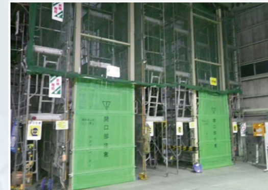
(株)日立ビルシステムエンジニアリングの研修施設