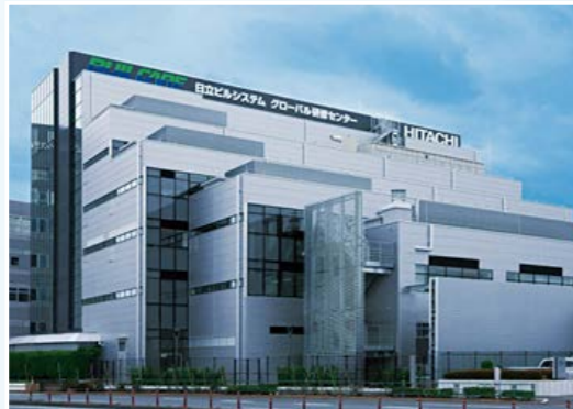
(株)日立ビルシステムの研修施設

昇降機メーカーの研修施設を利用し、実際に設置する製品に触れながら技能・知識を習得する場や、施工技術者間の情報共有の場を用意し、継続的に技能習得のサポートをしていきます。